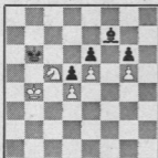
Hvid trækker og vinder

En materiel ligestilling, hvor den hvide springer dog er den sorte løber langt overlegen. De vil opdage løberens ubehjælpsomhed i gevinstspillet!