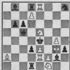
7544. A. Ellerman, Buenos Aires (orig.)