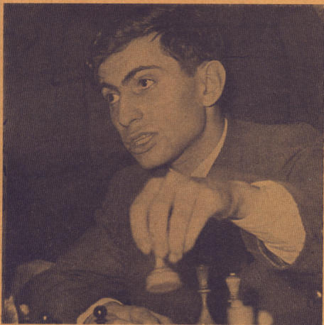
Verdensmester i 1960? Den 23 årige stormester Mihael Tal fra Riga