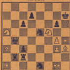
As-Suli manuskript? ca. 920.