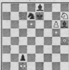
7542. L. S. Penrose 4. hædr. omt. S. African Chess Player 1958