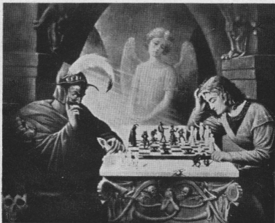
Djævelen spiller med den unge mand om dennes sjæl!

»Lad den unge mand rette et kombineret springer- og løberoffer mod Djævelens kongestilling, og han vil vinde alt sit materiale tilbage og sandsynligvis sejr i partiet!«