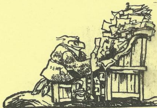
Redaktøren med et læs holdreferater.

Upst!! Sidste nyt, den udsatte kamp mellem Rødovre I og Brønshøj I endte 3\frac{1}{2}-4\frac{1}{2} efter god indsats. Fyldestgørende referat fra vor udsatte medarbejder følger i næste nervepirrende nummer.