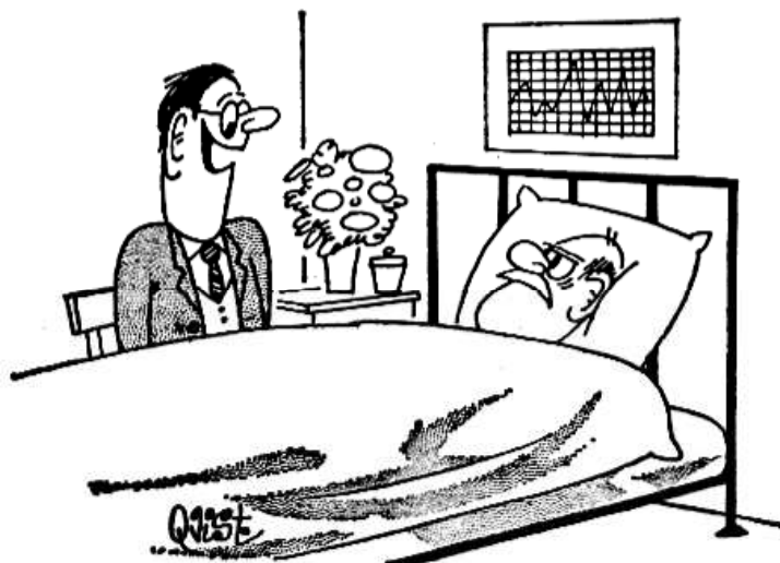
Personalet vedtog med 7 stemmer mod 5 at ønske direktøren god bedring.

4.holdet spillede en kamp mindre end de andre. Flemming (7 og 5) blev topscorer med 3\frac{1}{2} af 5. Leon (8) 3\frac{1}{2} af 6. Endvidere bør Verner og John nævnes for 3 af 6 på 1. og 2.bræt. Verner har nu i 3 år forsvaret det bræt med 50% hver gang! - Tara Gill (3) fik 2\frac{1}{2} af 3.