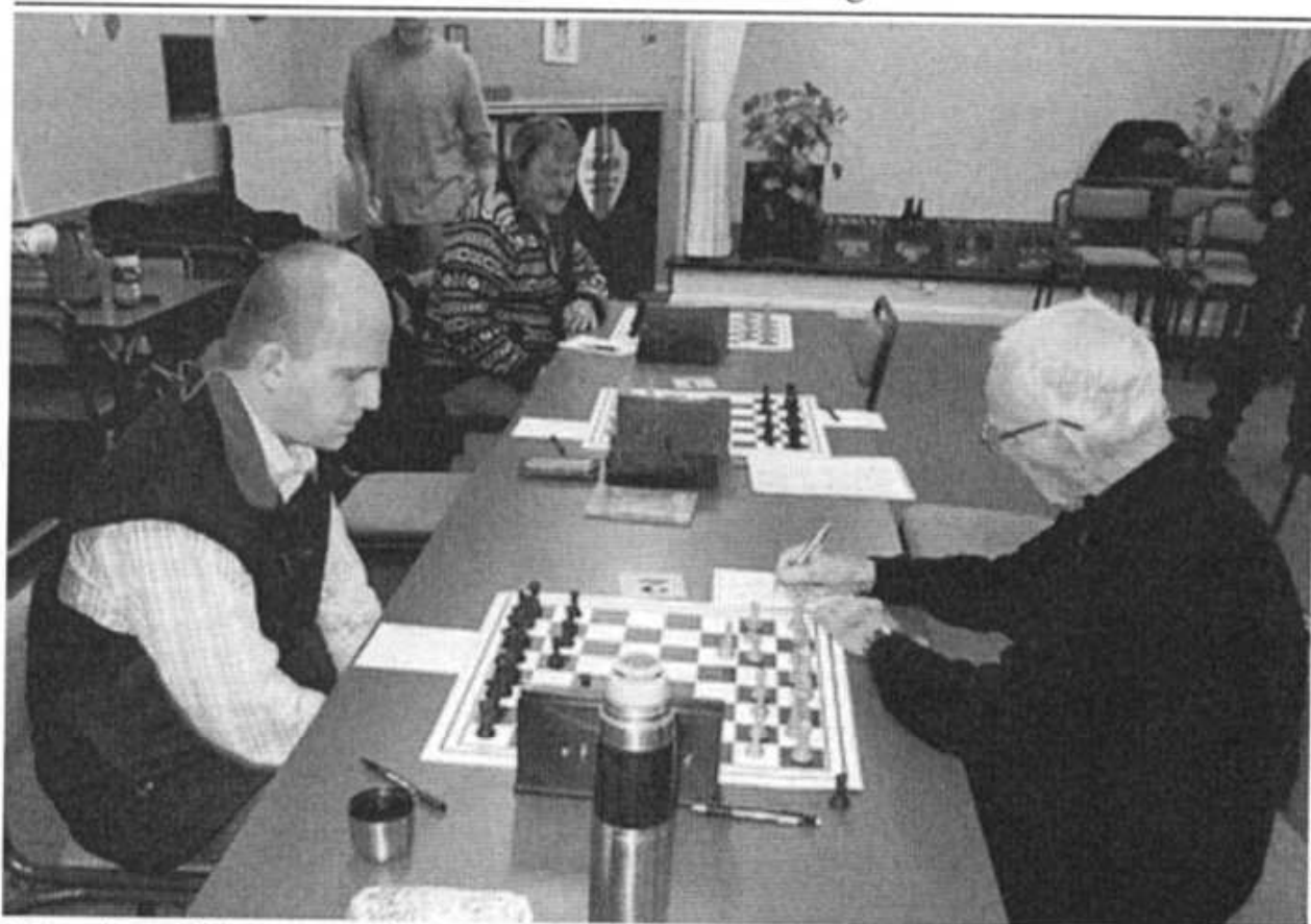
Miroslaw i kamp mod Valby