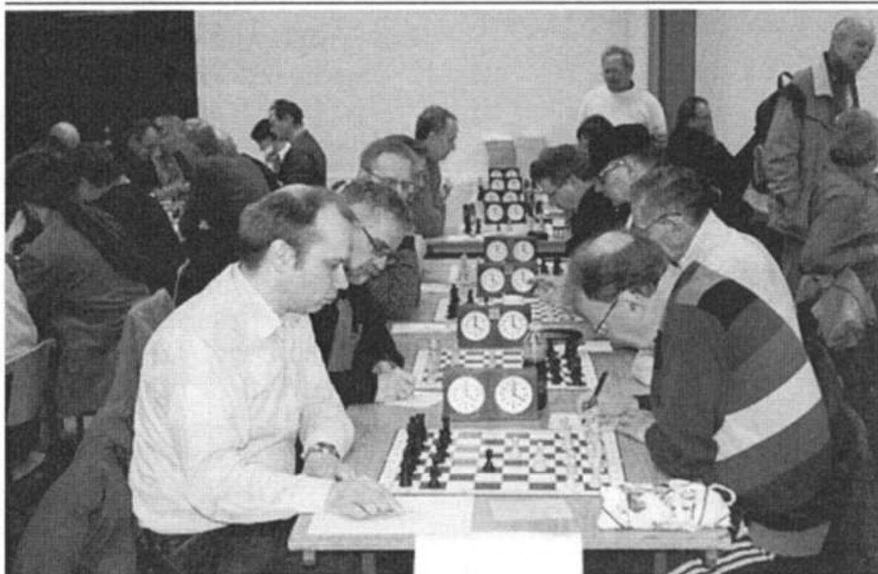
Fællesafslutning mod Lyngby-Virum, der desværre kun stillede op med 5 mand. Til venstre sidder superholdet fra Philidor.