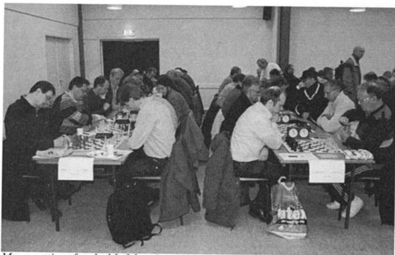
Mere action fra holdafslutningen