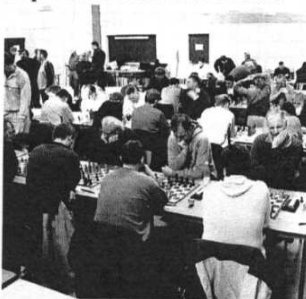
Koncentration på bundbrædderne.