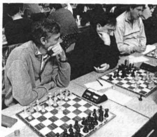
Ole vandt uden kamp, så han fulgte i stedet med i Pers parti.