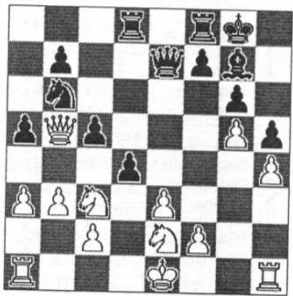
28. -, dxe3!!

Hvad betyder en officer i sådan en herlig stilling. 28...dxc3 29.Dxb6 Dd7 vandt selvfølgelig også. 29.Dxb6 læg mærke til at hvids dronning nu er off side! 29...exf2+ 30.Kf1 [30.Kxf2 Td2 31.Kf1 Lxc3 32.Sxc3 f6! med afgørende sort fordel.] 30...Tfe8 31.Tb1 Td2!? [31...Lxc3 32.Sxc3 De1+ 33.Kg2 Dxc3 med sort fordel.] Kurt ville gerne have sin ekstra halve time på klokken her, idet han kun havde 5 minutter igen. Han fik dog besked på pænt at vente til der var nået 40 træk!! 32.Dxa5 Txe2!