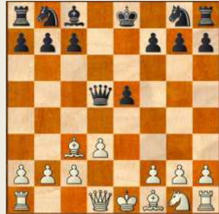
Stillingen efter 6. Lxc3 – en grundstilling i Philidors Angrebs afbytningsvariant.

3. exd5 Dxd5 4. Sc3 Lb4 5. Ld2 Lxc3 6. Lxc3