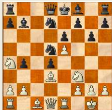
Stillingen efter 13... g7-g6.

1. c4 Sf6 2. Sf3 e6 3. Sc3 d5 4. d4 c6 5. e3 Sbd7 6. Ld3 dxc4 7. Lxc4 b5 8. Ld3 Lb7 9. e4 b4 10. Sa4 c5 11. e5 Sd5 12. 0-0 cxd4 13. Te1 g6