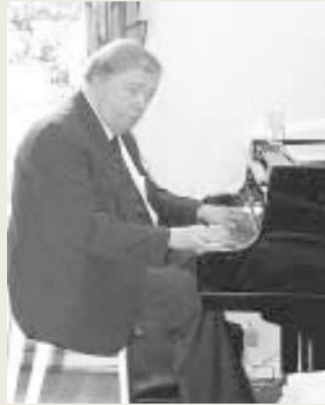
Kilde : Skakbladet 2004 / 3 - mindeord