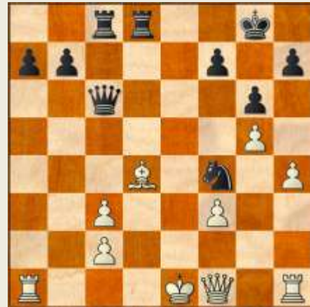
Stillingen efter 29. Kd2-e1.

29... Txd4! 30. cxd4 Dxc2 31. De2!?!? Samtidig med dette træk tilbød min modstander remis, men koldblodigt som vi korrespondancespillere er, gjorde jeg kort proces og sendte det stærkeste træk i stillingen: