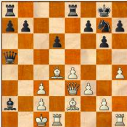
Stillingen efter 17... Le6xa2.

16. h4 Da5 17. Ld4 Lxa2 Igen det eneste træk, da der skulle gøres plads til springeren på e6, men fra nu af må sort regne med muligheden Kb2 fulgt af Ta1.