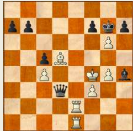
Stillingen efter 31... Lf6-h4!

31... Lh4! Så er den hvide mands skæbne beseglet.