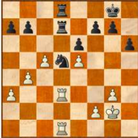
Stillingen efter 31. d4xe5.

31... Kf8? 32. T1d2? Ke8? 33. b5? Tc7? Hermed er det for en stund slut med kvalitetsgevinsten, men sort har stadigvæk en klart vundet stilling. Og sort får minsandten chancen for Sf4+ igen.