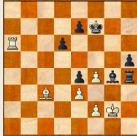
Stillingen efter 48... Kg1-g2?!

bondeofret 48. f3, der giver hvid flugtfeltet f2, det eneste, der udsatte matten om end ikke nederlaget. Den opståede stilling viser frugten af sorts strategi. Nu skal frugten plukkes i form af en tvungen matsætning.