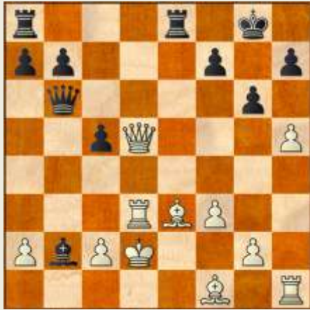
Stillingen efter 18. Kc1-d2.