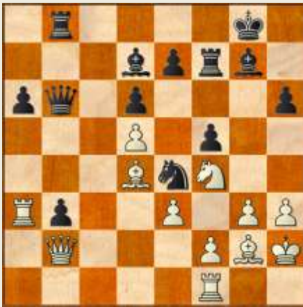
Stillingen efter 25... Sf6-e4!

En kæk lille krydsbinding, som umiddelbart sætter brættet i brand. Et par afbytninger slukker dog hurtigt denne.