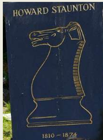
Mindesten på Howard Stauntons grav