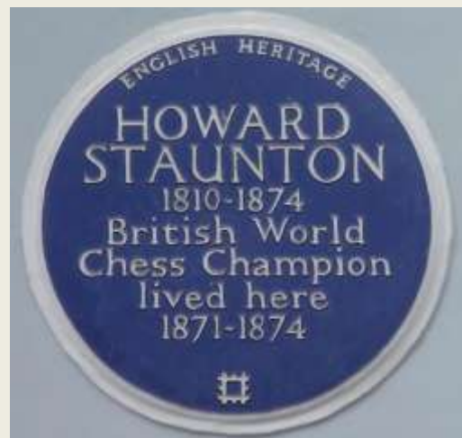
Mindeplade på boligen

Staunton døde i London i 1874. Der er opsat en mindeplade ved hans bolig på 117 Lansdowne Road, London W11 og på kirkegården Kensal Green Cemetery i London, er der på hans grav sat en smuk mindesten op med en indhugget springer.