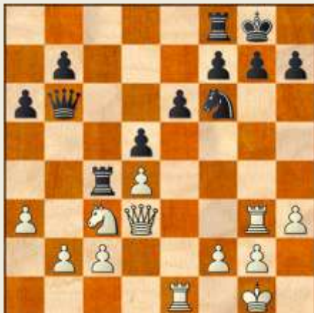
Stillingen efter 18... Dd6-b6!

15... Sa5 16. Tae1 Sc4 17. Sxc4 Txc4 18. Tg3? Db6! Mens sort med sit seneste træk har lagt op til en uholdbar fidus, foretager den sorte dronning et dobbeltangreb på hvids bondestilling (b2 & d4).