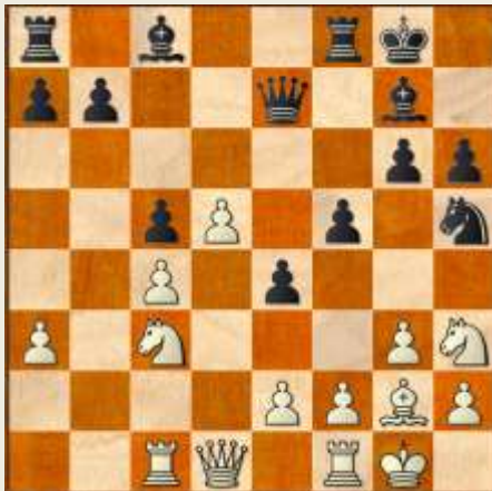
Stillingen efter 17... d6xc5. Garderet fribonde på d5 versus dominerende diagonalløber på g7.

15. d5! c5 16. bxc5 Sxc5 17. Lxc5 dxc5 Med sit bondefremstød i centrum og den følgende afvikling på c5 har hvid opnået en garderet fribonde på d5, men den er betalt med den i Kongeindisk så værdifulde løber på de sorte felter – så sorts ditto på g7 behersker nu smukt den lange diagonal h8-a1. Set i forhold til brikernes grundlæggende værdi er denne løber spillets mest værdifulde brik.