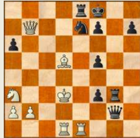
En trippelbonde behøver ikke at være svag! Stillingen efter 31... Tg8-g3!

31. Ld5 Tg3! Opretter nu et batteri på 3. række.