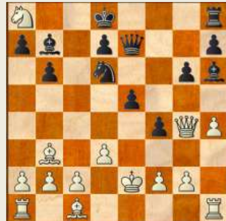
Stillingen efter 16. Ke1xe2.