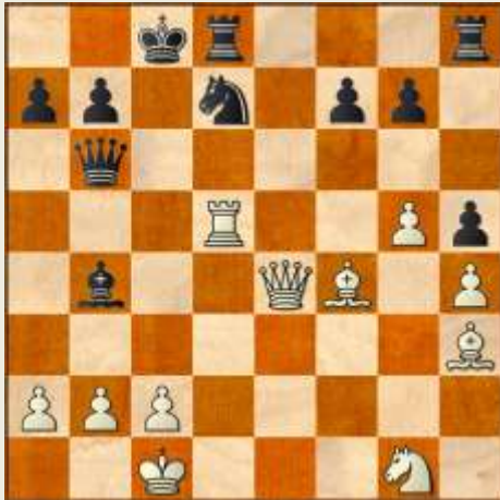
Stillingen efter 19... Lf8-b4

18. Txe4 Lxe4 19. Dxe4 Lb4 Fortvivlelse, men der truede tilintetgørende 20. Txd7! Txd7 21. De8+ Dd8 22. Lxd7#.