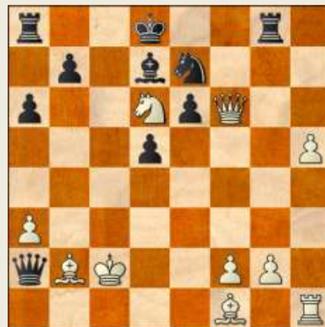
Stillingen efter 22. h5?!