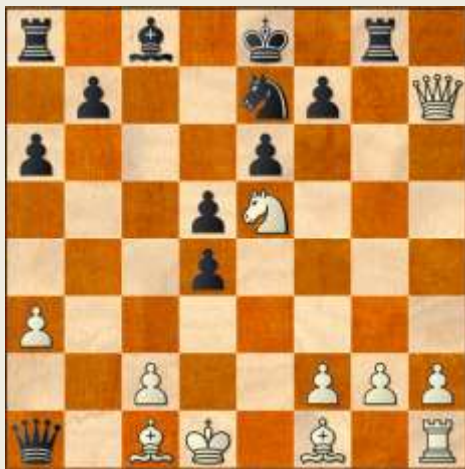
Stillingen efter sorts 14... a7-a6!?