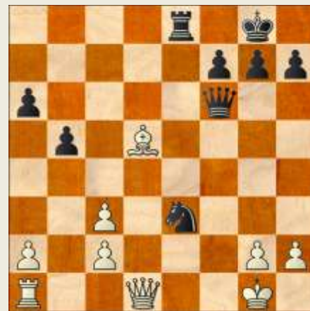
Stillingen efter sorts 21. træk

13... Lxf5 14. Txf5 Dc8 15. Lxf8 Dxf5 16. Lc5 a6 17. Le2 Sc4 18. Ld4 Te8 19. Lf3 b5 20. Lxf6 Dxf6 21. Lxd5 Se3 Endelig ikke 21... Dxc3? For 22. Lxf7+! Kxf7 23. Dd7+ fulgt af Tf1!