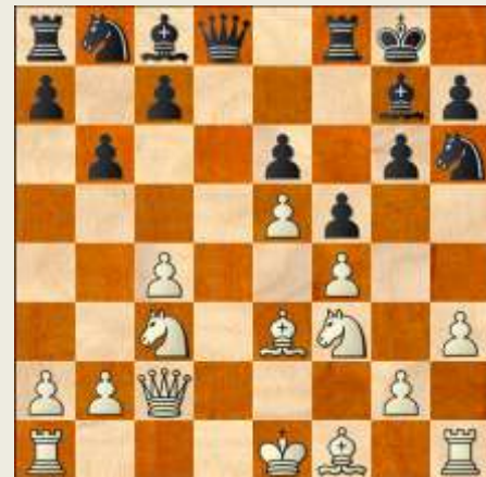
Stillingen efter sorts 11. træk

9. e5 e6 10. Dc2 dxe5 11. dxe5 b6 Normalt modsvares en vis terrænovervægt gennem mange bondetræk i åbningen af modpartens hurtigere officersudvikling, men her har sort som sagt spildt tre træk med sin kongespringer – Sg8-f6-g4-h6 – så hvid har fået terrænovervægten frit og kvit.