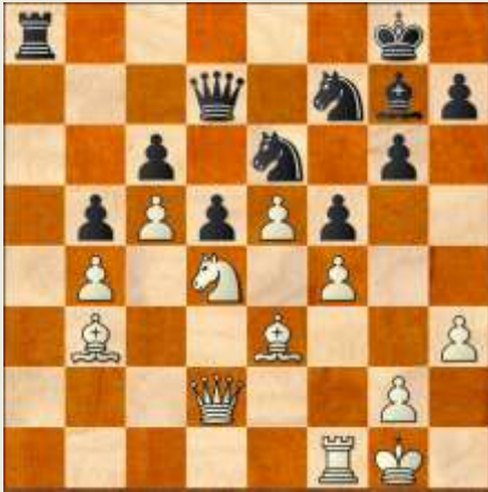
Stillingen efter sorts 24. Træk