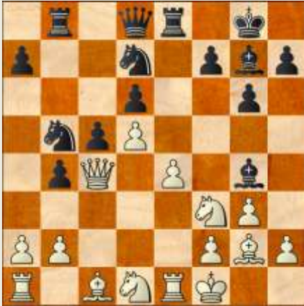
Stillingen efter sorts 17. Træk