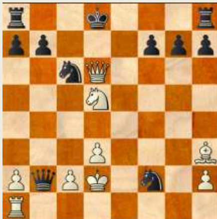
Slutstillingen i partiet Børgesen – Poulsen, 1962.

Interessant er 5. d3, hvis Sort med 5... Dh4+ viser sin eventyrlyst. Følgende parti viser Hvids gode chancer: Benny Børgesen – E. Poulsen, november 1962: 5. d3 Dh4+ 6. g3 Sxg3 7. Sf3 Dh5 8. Sxd5 Lg4 9. Lg2 Lxf3 10. Dxf3 Dxe5+ 11. Kd1 Sxh1 12. Lf4 Dxb2 13. De4+ Kd8 14. Lxc7+ Kd7 15. Lh3+ Kc6 16. Dc4+ Lc5 17. Se7+ Kxc7 18. Dxc5+ Kd8 19. Sd5! Sf2+ 20. Kd2 Sc6 21. Dd6+ opgivet. (KVA: Et typisk Benny Børgesen-parti – man drømmer sig uvægerligt tilbage til Adolph Anderssen og anden halvdel af 1800-tallets romantiske skak! Hvor må de to store talenter, Benny og Henning, have hygget sig og udvekslet muntre erfaringer i begyndelsen af 1960'erne i Frederiksberg Skakforening!)