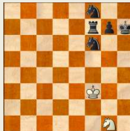
Hjælpemat i 3 træk