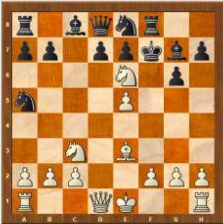
Slutstillingen i Fischer – Reschewsky, 1958/59

11. Se6! opgivet. På 11... Kxe6 følger 12. Dd5+ Kf5 13. g4+! Kxg4 14. Tg1+ og mat i få træk, f.eks. 14... Kf5 15. Tg5# eller 14... Kh5 15. Dd1+! Kh4 16. Dg4#. Og på 11... dxe6 falder den udækkede dronning med 12. Dxd8. Slutstillingen fortjener et diagram!