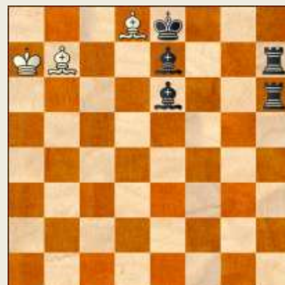
Hjælpepat i 3 træk