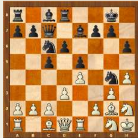
Stillingen efter hvids 13. træk

Hvad skal man kalde et sådant træk? Sort humor? De blinde plejer med deres sarkastiske selvironi at kalde det en blindebuk! I hvert fald fortjener sagen et diagram, da dette viser en stilling med samtlige brikker på brættet – lige før nådestødet.