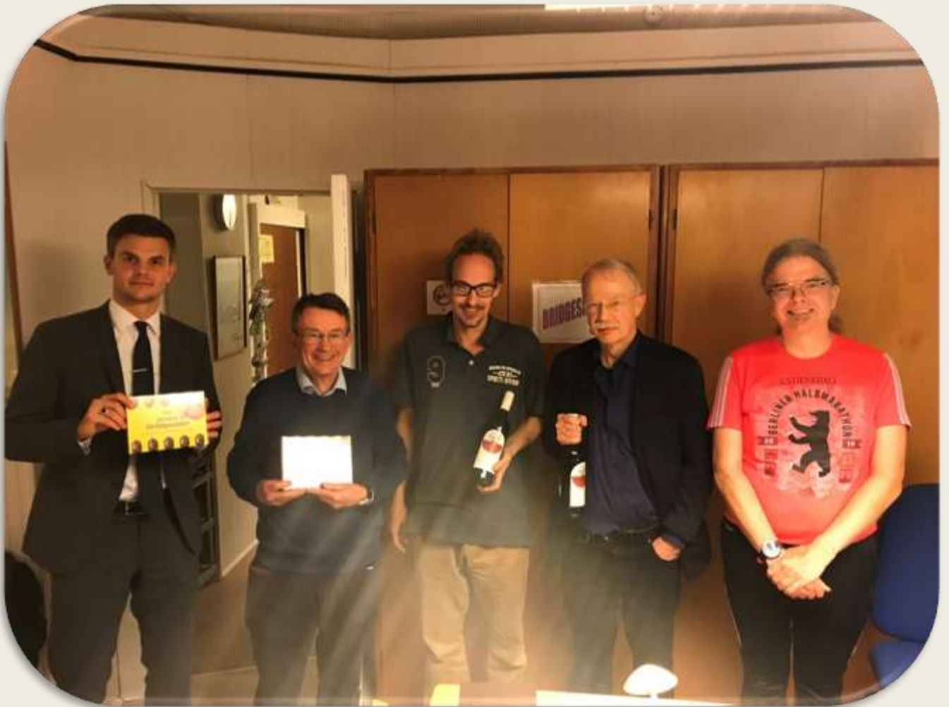
Præmietagerne fra højre mod venstre