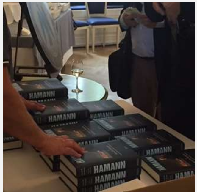
Man kunne naturligvis også købe bogen