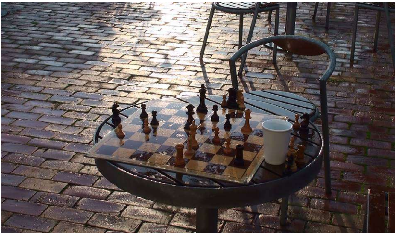
"Det haver så nyligen regnet"...