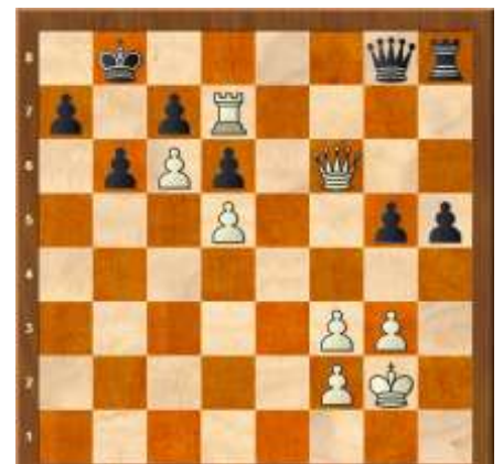
2: Hvid trækker - kan det vindes?