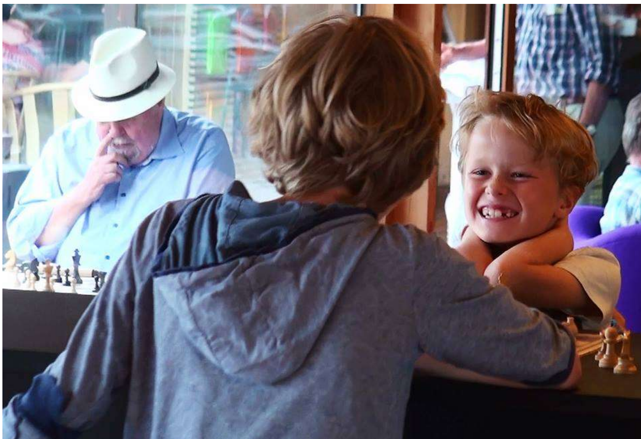
Glæde ved skak hos både den ældre og den yngre generation.