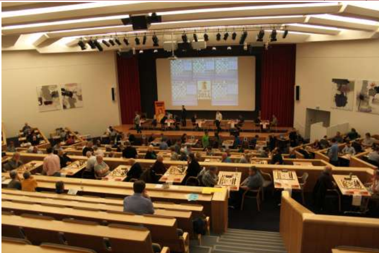
DM i Rebild bakker.