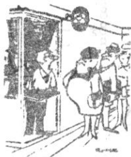
- Det her kan altså godt komme til at luge lidt ud ...

Klubben var som sædvanligt vært for kaffe og småkager, og kl. ca 20.15 lød klokken til start på aftenens HOLDLYNTURNERING .