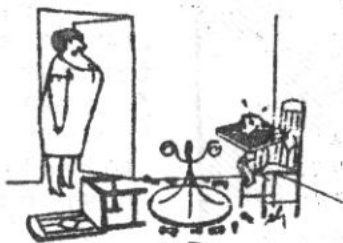
far tabte igen!