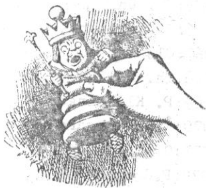
Illustration af John Tenniel til Lewis Carroll's bog »Bag ved spejlet«. Alice har grebet kongen.