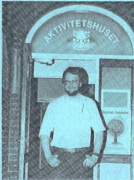
Ny formand - nye lokaler