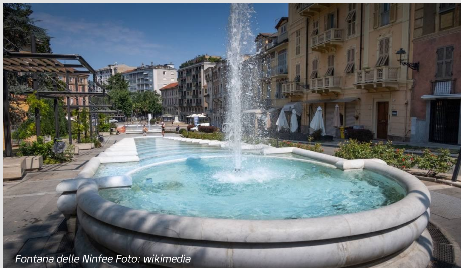
Fontana delle Ninfee

Acqui Terme er en meget gammel by. Den varme kilde springer stadig op på torvet, og ruiner fra det første århundrede minder om, hvor længe mennesker har levet, handlet og