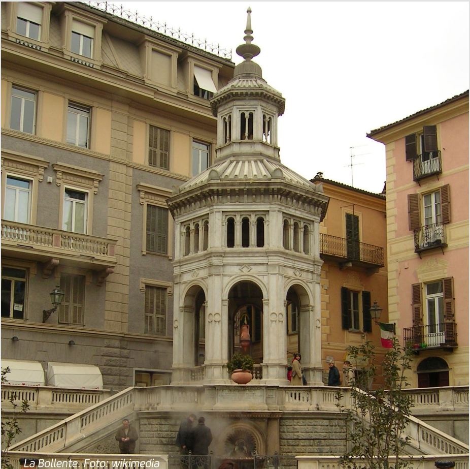
La Bollente.

Og så endnu en lille smule. Indtil stillingen selv fortæller, hvad næste træk skal være.