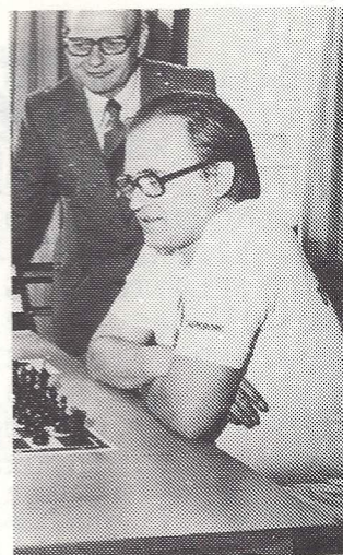
Bent Larsen - spiller igen i Danmark.

Sikre deltagere skulle være John Nunn (2600), Bent Larsen (2565),