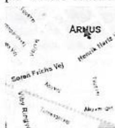
.... og placering

Et andet vigtigt emne ved generalforsamlingen var bestyrelsens forslag til vedtægtsændringer . Disse blev enstemmigt vedtaget af generalforsamlingen, efter et par mindre rettelser. De nye vedtægter betyder bl.a., at bestyrelsen for Chess House fremover vil bestå af 7 bestyrelsesmedlemmer og ikke 5 som tidligere.