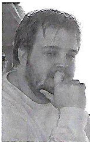
Ingen remis til juniortalentet fra Skanderborg!

fx en dronning på d6 får fint modspil) 12...Lf5 13.Tg5 (13.fxe4? Lg4) 13...Lg6, og selv om tårnet på g5 ser ganske aktivt ud, kan det nemt komme til at stå akavet. Sort tillader hvid at tage sin bonde igen på e4, og bryder i stedet op med ...e5. Fx 14.Le2 e5 15.d5 Sd4 16.fxe4 c6, og der er stadig alt at spille for, men med åbningen af c-linien får sort også meget hurtigt spil mod hvids konge. 12.d5 Sd4 13.hxg6 hxg6 14.fxe4 Lg4 15.Te1 c6 16.dxc6 16.Lh6 er oplagt, men efter 16...Lf6 17.Kb1 (17.Lxf8? Lg5) 17...Tf7 undgår sort afbygningen. 16...bxc6 16...Sxc6? 17.Lxb6 koster en kvalitet for sort, pga skakken på c4. En tydelig konsekvens af, at hvid fik lov til at åbne h-linien. Stillingen er efter partitrækket nogenlunde i balance. 17.Lh6 Df6 Første helt nye træk ifølge basen, 17...De7 er spillet en enkelt gang før, også med hvid gevinst til følge. Spændende er 17...Se6!? 18.Lxg7 Dxg7