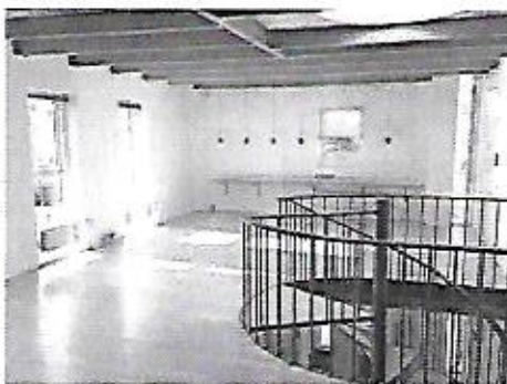
Spillesal, 1. etage