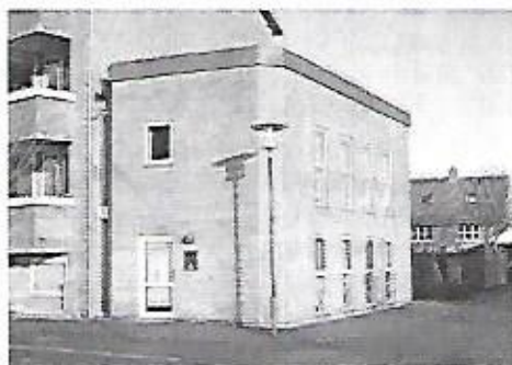
De evt. nye lokaler i Åbyhøj/sydvest