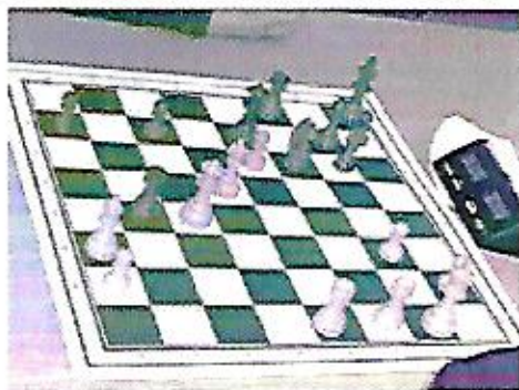
Jens Abildlund lægger hårdt ud: Lc1-a3!

Alle 3 hold lagde dog moderat ud, AGF ved kun at spille uafgjort med Remis –