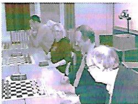
Nordreholdet Lille Meyer forsøger at skrabe sammen til indskuddet ...