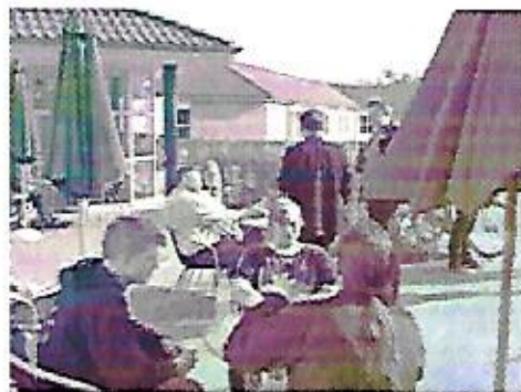
Det var som bekendt godt vejr under DM, selvom det var tilbage i april!

i nogen tid, forstod jeg endeligt, at hvis hvid får lov til at gennemføre sin plan, så er sort færdig. Så nu gjaldt det "bare" om at stoppe hvid. Der er to måder man kan forhindre modstanders plan på - enten direkte ved at dække de kritiske felter, eller indirekte - ved at skabe modtrusler som han ikke kan ignorere. Efter at have tænkt i et par minutter fik jeg øje på en smart forsvarsmulighed: 19...Dd6!! 20.Tafl Hvid er klar til at sætte mig mat i h-linien. 20...Db4! Her er den modtrussel som hvid ikke kan ignorere. Han kan jo ikke tillade, at vi hytter damer af, fordi så ryger hele hans plan i vasken! 21.Dc1 Dc5! Sort bliver ved med at true. 22.Dd2 Db4 23.Dc1 Hvis hvid sætter dronningen på d1, standser hans angreb, og sort vil få tid til at finde på nye trusler. Hvid er nødt til at acceptere trækgentagelsen. Remis! Det sjove er, at efter hvids 19.Tf4 anså både min modstander og kommentatoren (Per Andreasen) min stilling for at være tabt! Folk er generelt tilhøjelige til at undervurdere forsvarsressourcer, muligvis fordi de ikke er iøjnefaldende og er ret svære at finde. \frac{1}{2} - \frac{1}{2} ♥