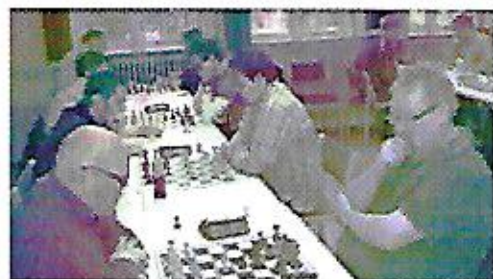
Vinderholdet Team TABS til højre – her i kamp mod Double up i Chess House

måtte afgive en enkelt remis – lige præcis nok til, at Team HABS med en 12-0 sejr over de næsten fire tænder kunne tage sejren udelte. Lille Meyer fik bugt med Svineinfluenzaen og satte sig på den samlede 3. plads.