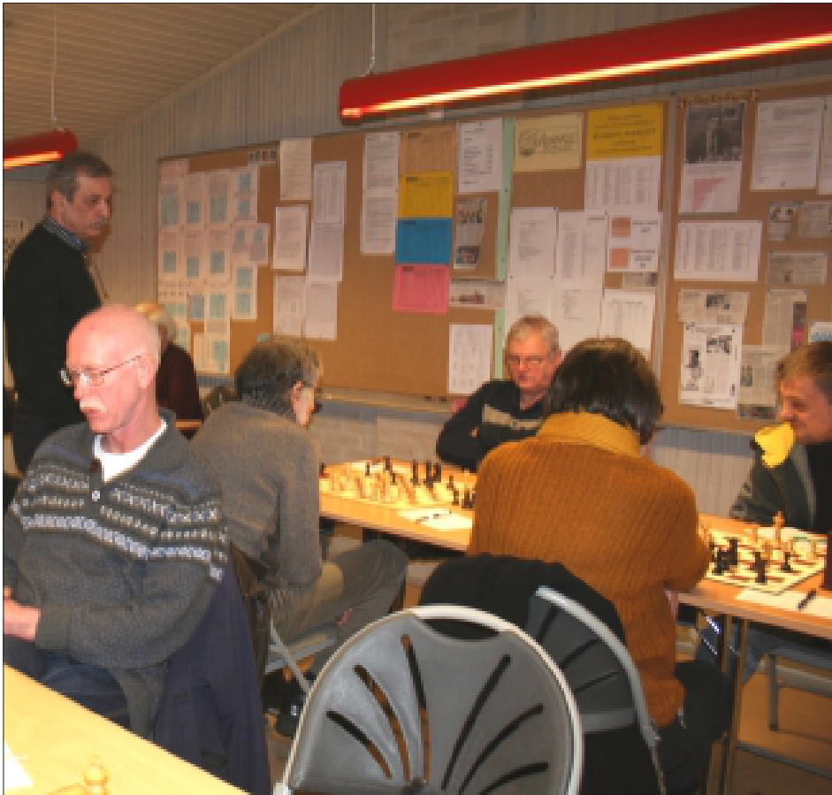
Udsnit af 2.-holdet på hjemmebane undervejs mod den hæderfulde oprykning til 2. række i KSUs Holdturnering

Medlemsblad for Hvidovre Skakklub * Nr. 2 * Maj 2013 * 62. årgang